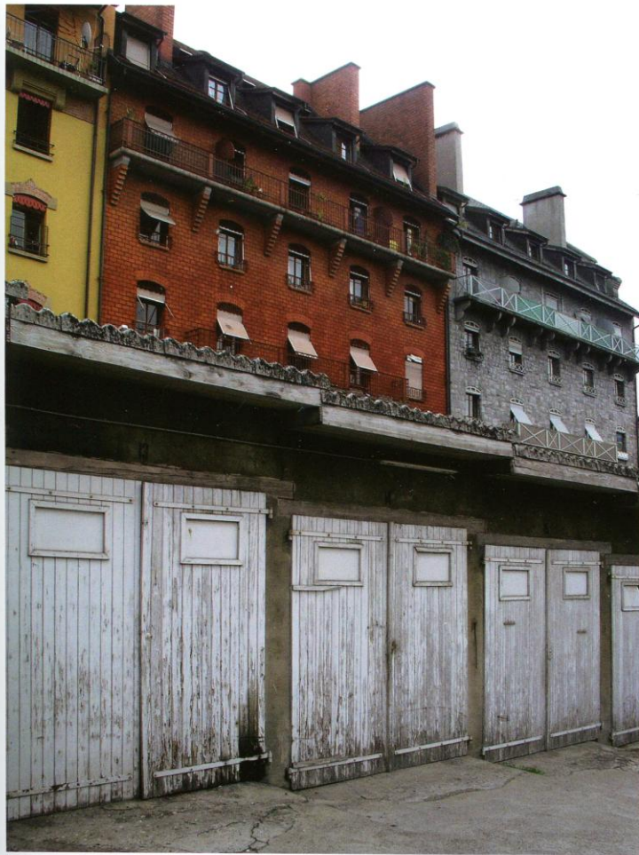
2006. Garages de bois et maisons de briques. Quartier des Grottes. Genève.