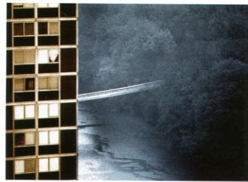
2003. La passerelle et la tour. Le Lignon, Genève.