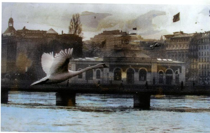
1986. Envol d'un cygne.

En 2007, charmé par l'architecture de Saint-Pétersbourg, JJK explore Genève à la recherche d'un patrimoine architectural caché, il promène son regard dans les quartiers et photographie les richesses dissimulées. Pour la Fondation Brailard, il photographie l'état des lieux des endroits propices au développement futur de Genève.