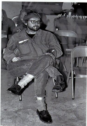
1992. Autoportrait avec 3 jambes.