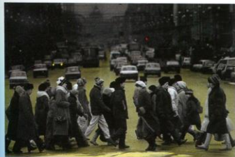
1993. Perspective Nevsky, la grande avenue. Saint-Petersbourg.